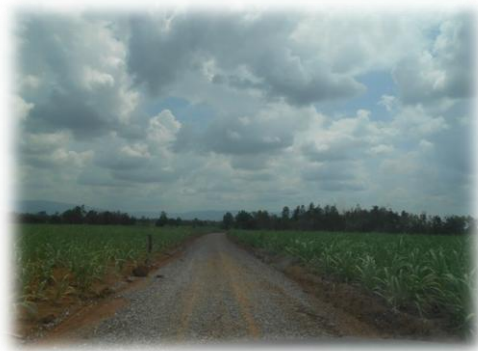
ลงหินคลุก ภายในตำบลท่าใหญ่