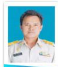
อบต.ท่าใหญ่

สมาชิกสภาองค์การบริหารส่วนตำบล หมู่ที่ 4