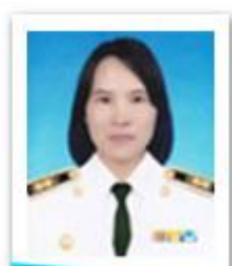
อ.ต.ท่าใหญ่