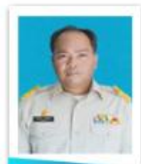
อบต.ท่าใหญ่

สมาชิกสภาองค์การบริหารส่วนตำบล หมู่ที่ 1