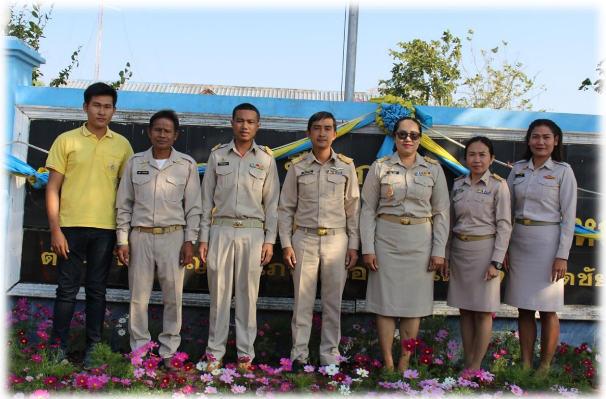
-งานช่วยเหลือและให้บริการประชาชนในกิจการสาธารณประโยชน์