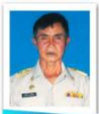
อบต.ท่าใหญ่