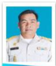
อบต.ท่าใหญ่