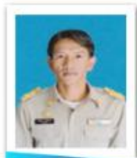
อบต.ท่าใหญ่