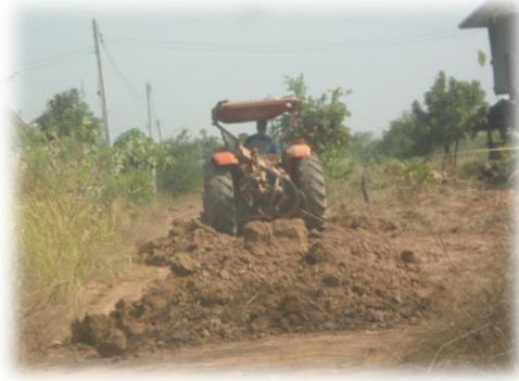
ถนนเพื่อการเกษตร ภายในตำบลท่าใหญ่