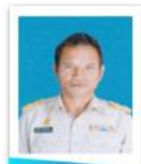
อบต.ท่าใหญ่

สมาชิกสภาองค์การบริหารส่วนตำบล หมู่ที่ 2